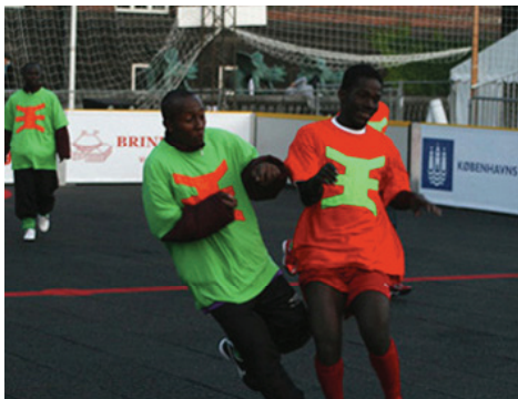
Homeless World Cup, Pitch_Africa

Publicação reflete sobre experiências que relacionam arte, arquitetura, design, história e política; lançamento acontece dia 23.10 , no SESC Avenida Paulista